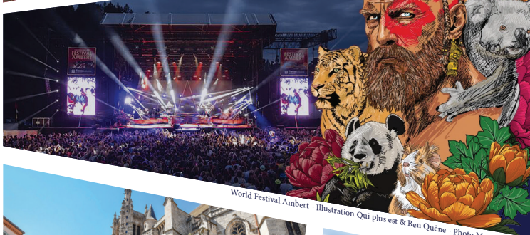
World Festival Ambert - Illustration Qui plus est & Ben Quéne